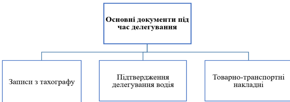
Рис. 3. Обов'язкові документи, які мають бути у водія під час його делегування до Польщі

Для проходження контролю зі сторони уповноважених на здійснення перевірки осіб делегований до Польщі водій в обов'язковому порядку повинен мати у своєму транспортному засобі відповідні документи (рис. 3).