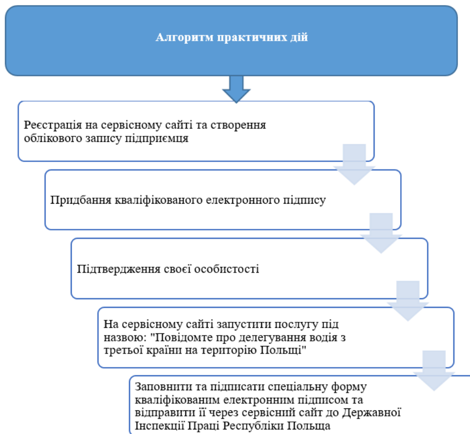
Рис. 2. Алгоритм практичних кроків зі сторони автоперевізника в процесі делегування водія до Польщі

Далі, зайшовши у свій обліковий запис на сервісному сайті, необхідно запустити електронну послугу «Повідомлення про делегування водія з третьої країни на територію Польщі» [10]. Заповнивши та підписавши форму кваліфікованим електронним підписом, слід відправити її через сервісний сайт до Державної інспекції праці Республіки Польща. [7]. У разі неможливості отримання електронного підпису ви маєте можливість виконати процедуру за допомогою повіреної особи, що володіє електронним підписом.