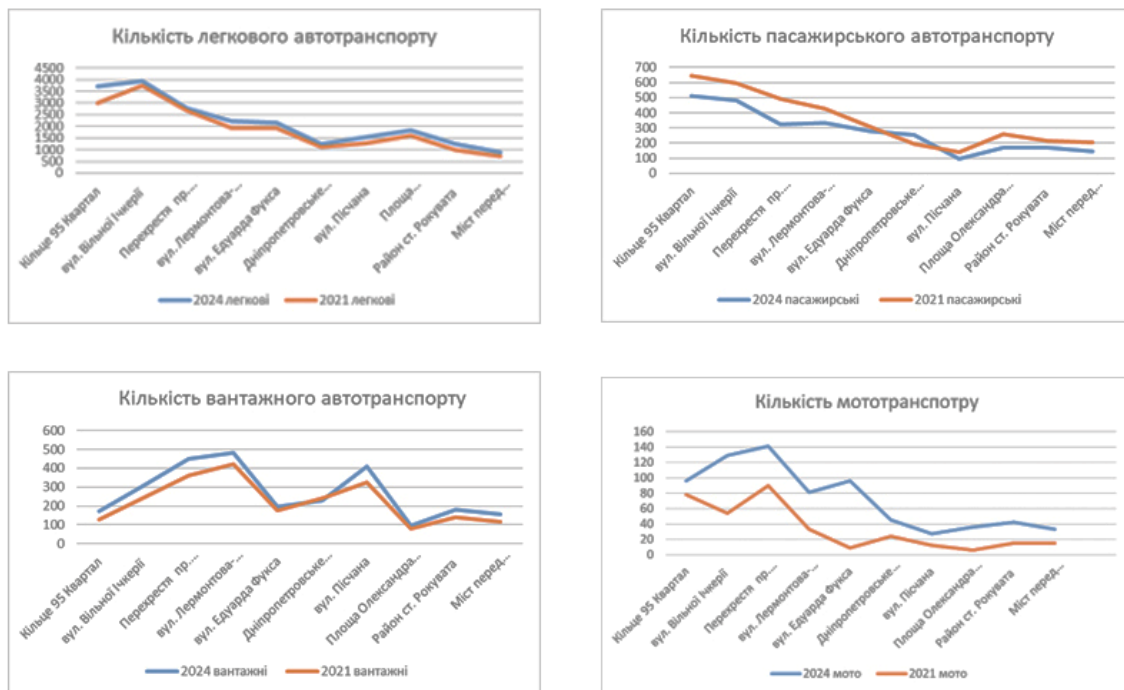
Рис. 1. Динаміка змін транспортного навантаження

Візуалізація результатів представлена у вигляді порівняльних графіків, що дає змогу виявити ключові тенденції розвитку транспортної системи міста (рис. 1).